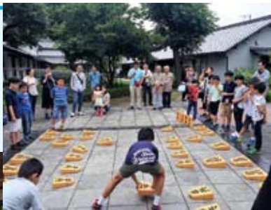
昨年のジャンボ将棋まつりの様子